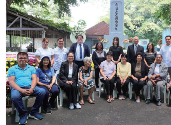
慰霊祭に参列した塩村あやか参議院議員、在ダバオ総領事館、沖縄県使節団、在留日系人ら二太田勝久撮影

ミンタナオ地方ダバオ市ミンタルの共同墓地で16日、毎年恒例の慰霊祭が開かれた。今年は玉城デニー沖縄県知事のメッセージを携えた県庁使節団、塩村あやか参議院議員、在ダバオ総領事館員、在ダバオ日系人会(PNJK)、PNJKインターナショナルスクールのミンタナオ国際大会、ミンタナオ日本人商工会議所、フィリピン日系人リリーガルサポートセンター、ダバオ日本人会、日本フィリピンボランティア協会あすなろ会